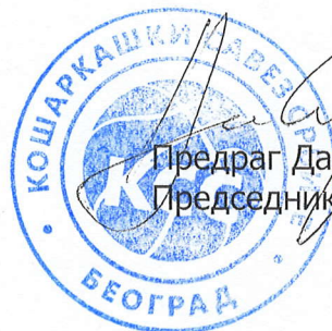
Предраг Даниловић Председник УО КСС